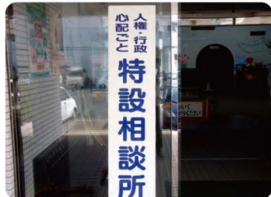
心配ごと相談(毎月5の付く日)