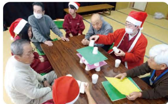
岩美高校サロン体験交流事業