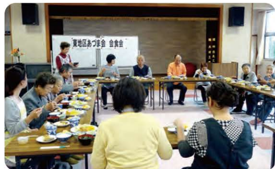
食事サービスボランティア主催の会食会