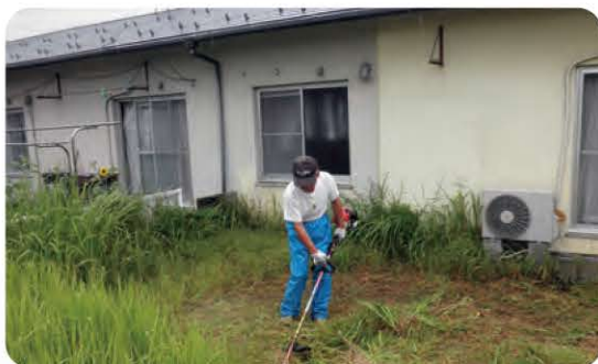
高齢者ファミリーサポートシステム 一人暮らしの高齢者のお宅で草刈り作業