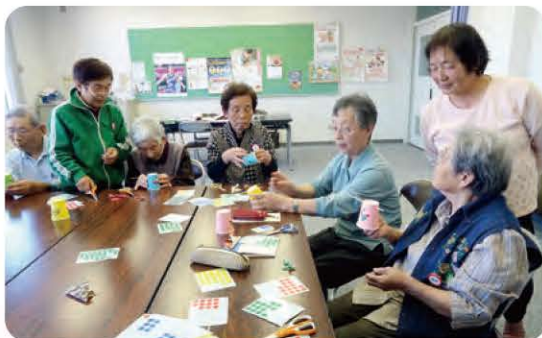
あったかハートサロン