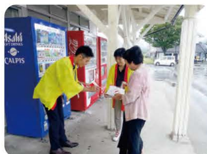
赤い羽根共同募金（街頭募金）