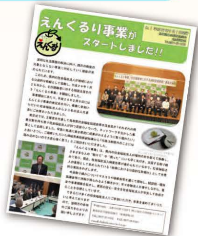
えんくるり事業広報 (県社協発行)