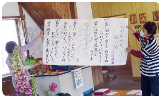
ふれあいいきいきサロン