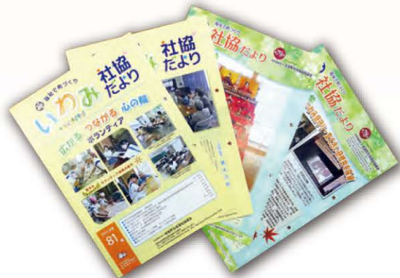
社協だより（年4回発行）