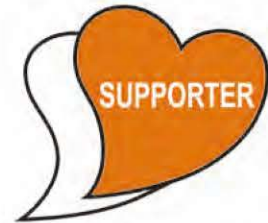
あいサポートバッジ