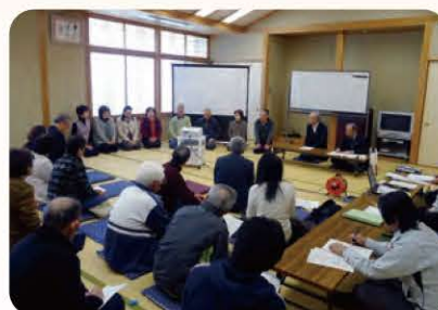
地区別福祉座談会（9地区）