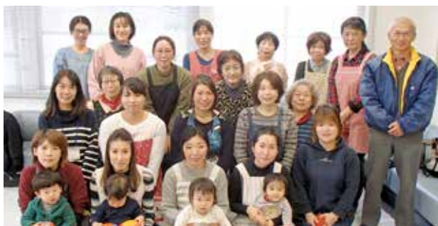
元気いっぱいの参加者とスタッフのみなさん