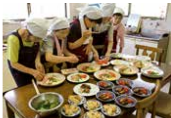
調理や盛り付けはテキパキと