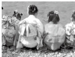
南阿田 流し雛保存会

教育・子育て・防災・住民参加のまちづくりなどにつながる活動を行う団体への支援のために。