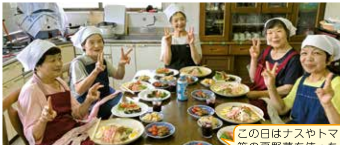
料理が完成！笑顔でハイチーズ♪