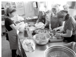
五條市 手をつなぐ育成会