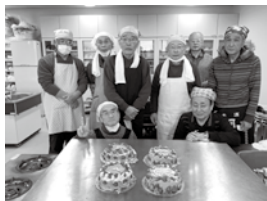
田園地区サロン 男の料理倶楽部

地区社協が実施する高齢者・子育てサロン、世代間交流や敬老会などの福祉活動のために。