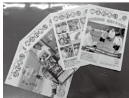
社会福祉協議会 広報「ふれあい」

年4回発行する広報紙発行費の一部として、地域福祉情報の発信や福祉教育の啓発のために。