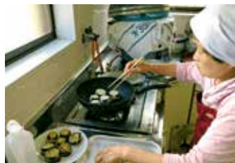
さすが主婦のみなさん