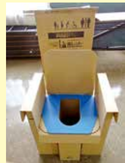
ダンボール製のベッドとトイレ