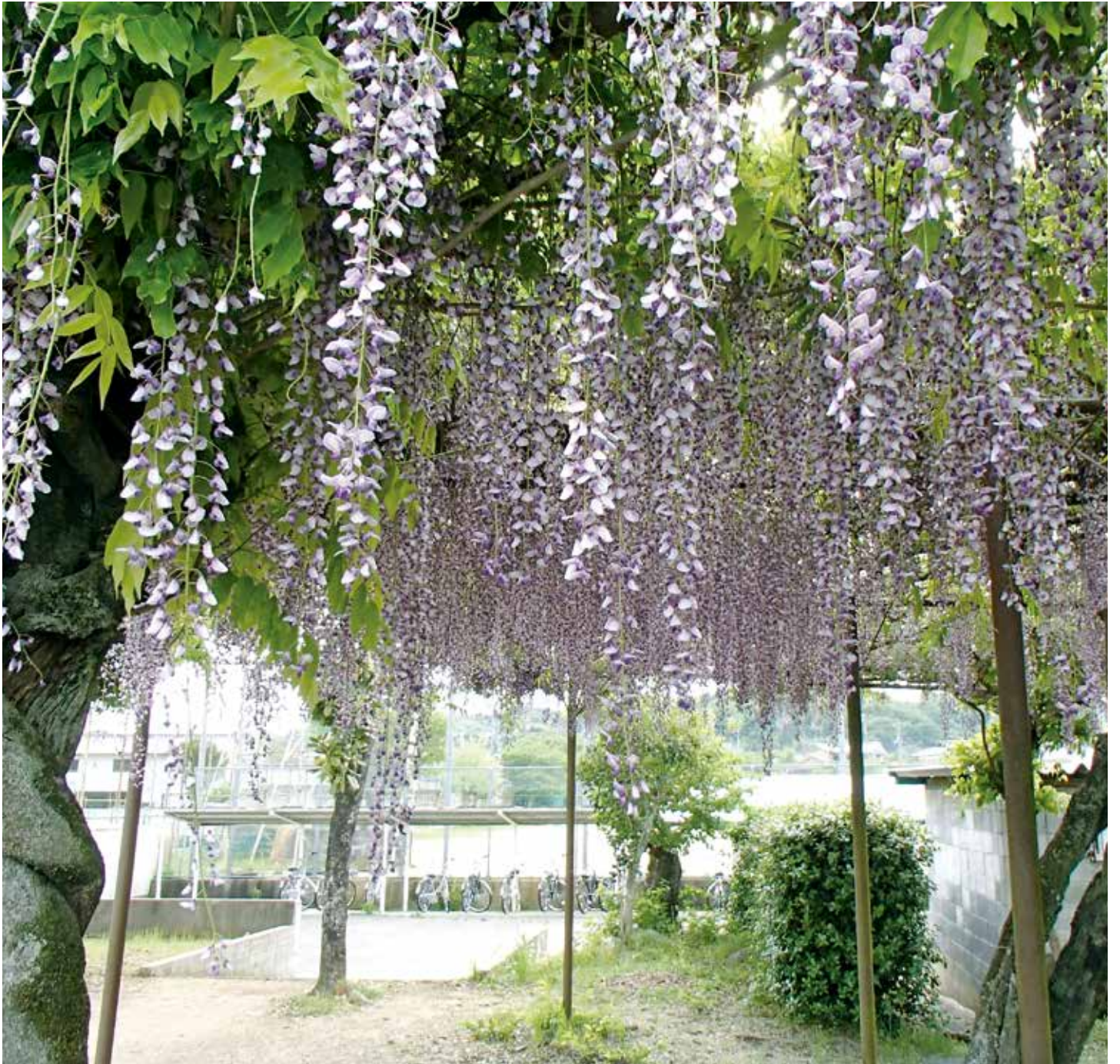
五條中学校の藤棚