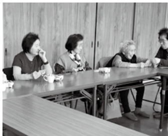
笑顔あふれる茶話会