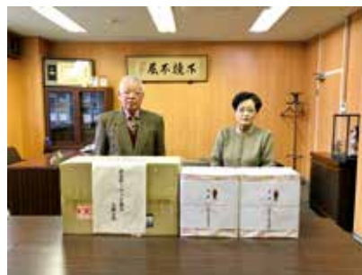
文具等寄贈の様子

五條市善意銀行にいただいた皆さまからのご寄付の一部を払い出し、生徒のために役立てていただくとうと五條市内の中学校に図書を、児童養護施設「社会福祉法人嚶鳴学院」には文具一式を寄贈しました。また奈良県トラック協会五條支部よりご寄付いただいたタオルやウイルス対策用キット等も寄贈させていただきました。