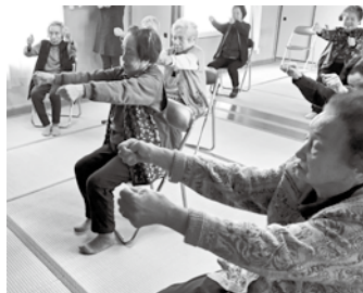
体を動かしリフレッシュ