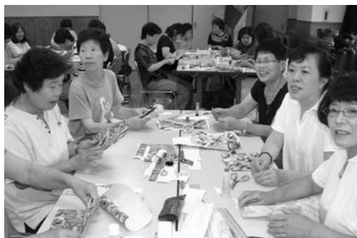
昨年8月の研修模様