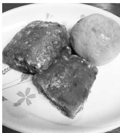
出来上がった「くるみゆべし」。