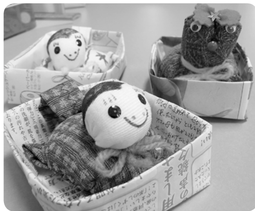
給食サービスで配りました！

店の中には、ご自身で作られた手芸品がた くさん置いてありました。今年の冬は寒かつ たので手編みの帽子がよく売れたそうです。 これからの目標は、「千支を手芸で作ること」 に挑戦していきたいとのことでした。新しい 手芸品を楽しみにしています！