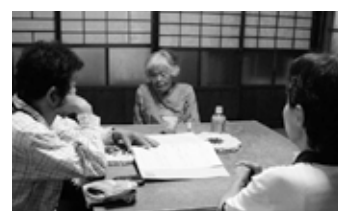
手前2人がボランティア

今年からは新しいボランティアも増え、より活発にお話し相手ボランティア活動が展開されると思います。お話し相手ボランティアに興味、関心がある方、また自宅に来てほしいと思われる方は、ぜひ社協までご連絡下さい。