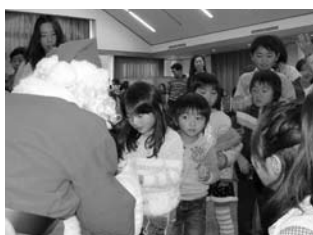
サンタさんからのプレゼント

また、1月25日には、乳幼児とのお家の方が集まり、音楽に合わせたリズム遊びを楽しみます。