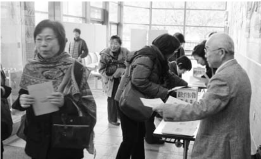
文化協会による歳末募金の呼びかけ