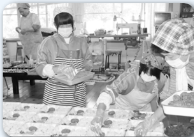
ボランティアの方と福祉給食の盛り付けを行いました