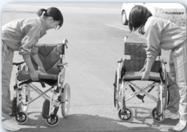
車椅子の使い方も学びました

5日間、町内の方との出会いの中で、仕事の楽しさや厳しさ、社会のルールなどについて感じ学んでもらえた様に思います。