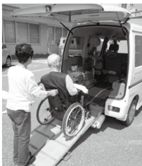
病院への送迎サービス

2. 外出困難者への支援 ① 現在無償で行っている、体が不自由な方の病院送迎サービスは、今後利用者が増加が見込まれるため、利用者から実費負担を求めた福祉有償運送に切り替えます。