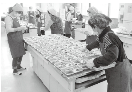
福祉給食サービス