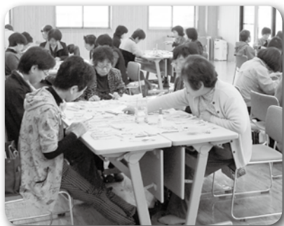
木製洗濯ばさみを使います

ミニディボランティア研修会は、偶数月の第1木曜に開催します。詳しいことは社協ボランティアセンターまでお問い合わせ下さい。