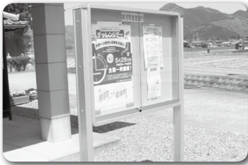
新しくなった掲示板（貝野区）

24年度は3件の助成を行いました。 集落において、地域福祉を高める活動や住民の安心安全となる活動で、かつ利用ニーズが高い、もしくは緊急性が認められ、理事会で審査したうえで、上限50,000円の総額150,000円を助成しました。