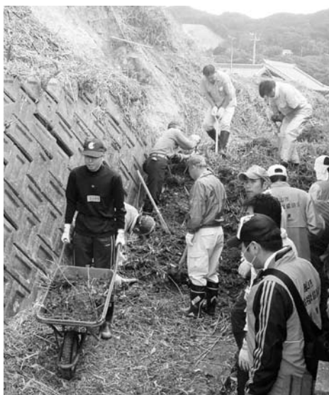
災害時に活躍するボランティア

修、意見交換会を複数開催するとともに、職員が積極的に現地へ出向いて活動の相談に乗ります。 4. 災害に備えた体制づくり ① 大規模災害時に開設する災害ボランティアセンターの運営について、町との協定を結ぶための協議に入ります。 ② 本会災害対応マニュアル及び災害ボランティアセンター運営マニュアルを再点検し、協定に基づいた内容となるよう見直しを図ります。