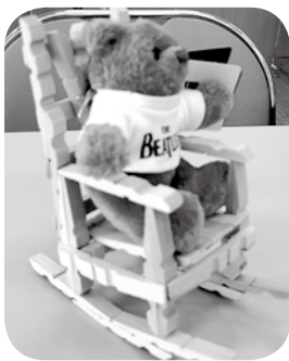
出来上がった作品