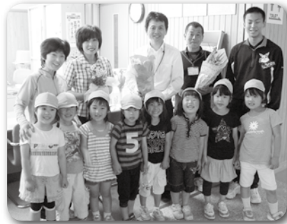
毎年神崎保育園からお花を頂いています (写真は昨年度)

兵庫県では、県民一人ひとりの善意と誠意を結び、集めてることによって社会の福祉を増進し、明るく豊かな郷土づくりを進めていきたいと念願し、昭和39年に6月1日を『善意の日』と定め、それ以後毎年6月を善意の月間として各地で運動を展開しています。