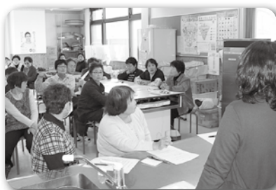
検食方法の説明会

が起らないようにすることであり、そのための注意を怠らず、給食サービスのお弁当を楽しみに待っていただける利用者の皆さんに、安心・安全なお弁当をお届けしていきます。