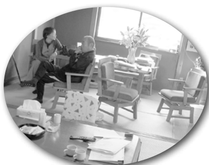
近所に遊びに行く感じで。