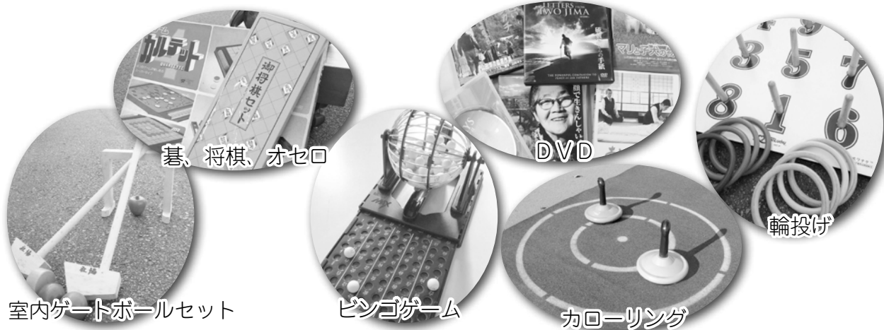
室内ゲートボールセット