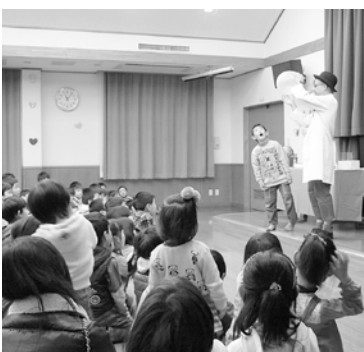
クリスマス会の様子