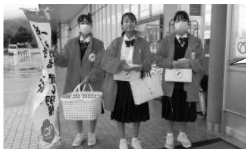
神河中学生在 街頭募金を 行ってくれました。