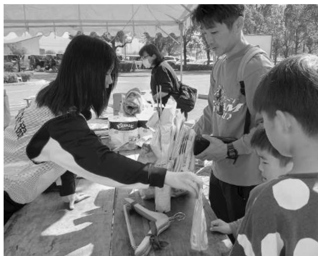
レジでも活躍「ご購入ありがとうございます！」