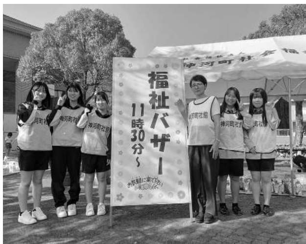
バザーに参加頂いた神崎高校のメンバー