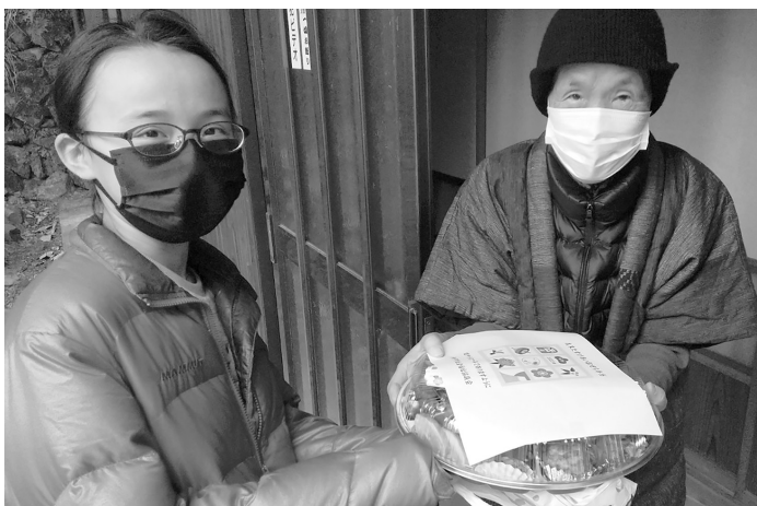
小、中、高校生ボランティアがおせち弁当をお届けしました。

10月から12月にかけて、町内の皆さまへ「歳末たすけあい募金」のお願いをしたところ、今年も多くのおいしいお気持ちが集まりました。 お寄せいただいた募金を活用し、障がいをお持ちの方への外出イベント、ご家族の介護をされている世帯へのお見舞品配布、また年末年始をおひとりでご過ごされる高齢者の方へのおせち弁当をお届けいたしました。 この募金の取りまとめにご協力頂きました、区長様はじめ、区役員様にお礼申し上げます。