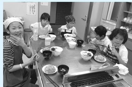
この日のメニューは、 チャーハン、サラダ、お吸い物

参加者を随時募集されていますので、活動に興味を持たれた方は、はぐくみきっずでクッキングしてみませんか。