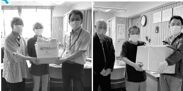
根宇野老人クラブ