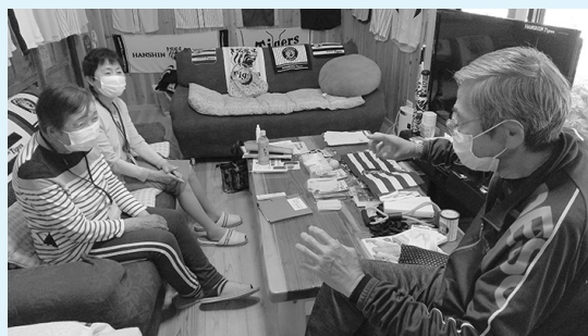
ボランティアの活動の様子

現在、一緒に活動いただける方を募集しています。月1回からの参加も可能です。活動の詳細は、社協までお問い合わせください。