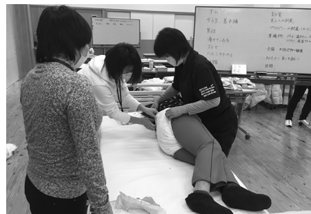
過去の初任者研修時の様子