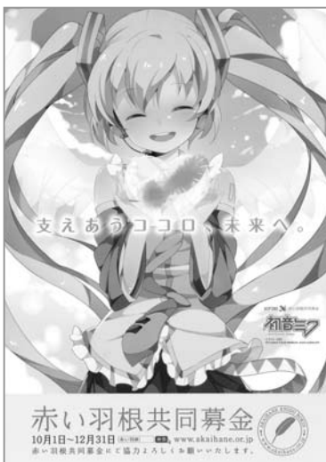
今年度のポスター

10月中旬、町内の各事業所を個別に訪問し、事業所募金のお願いにお伺いいたします。