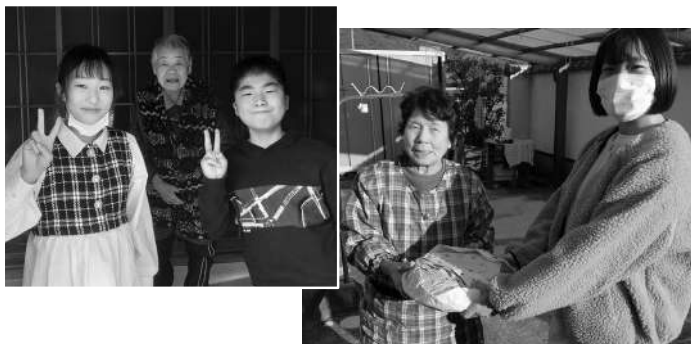
小、中、高校生ボランティアがおせち弁当をお届けしました。

10月から12月にかけて、町内の皆さまへ「歳末たすけあい募金」のお願いをしたところ、今年も多くの温かいお気持ちが集まりました。