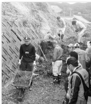
淡路市で活動した 町内からのボランティア

2月には県からの補助金を活用し、7名の住民に※防災士資格を取得してもらい、大災害時の「災害ボランティアセンター」の運営人員の確保に努めました。 ※防災士：日本防災士機構による民間資格で、防災に関する知識や技能を備えた地域の防災リーダーとして期待。