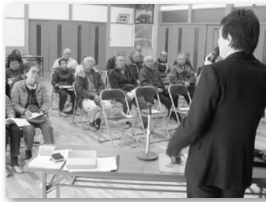
福祉懇話会（山田区）

災害をテーマに実施してきた福祉懇話会を残り23集落で順次開催し、被災地派遣の体験談を交えながら参加者の防災意識を高めました。今後地域に出向き意見交換を行う必要性があると考えます。 福祉懇話会は地域住民と直接意見交換ができ、日ごろの社協活動に対する評価も得ることが出来ます。一方で「社協活動があまり見えてこない」といった指摘を受けており、年度後半には社協活動番組を放映し、PRに努めています。