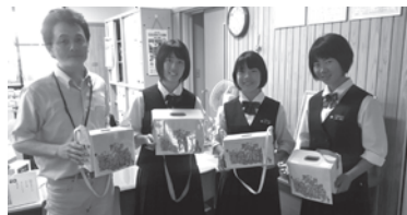
神河町 善意の募金預託

*善意の募金1,067,712円(-0.1%) *社協会費<加入率80.3%>3,366,000円(-0.5%) *特別会費<91事業所>536,000円(-1事業所) *赤い羽根募金<次年度約8割が神河町社協へ配分>2,398,743円(+0.42%) *歳末たすけあい募金1,792,225円(+1.49%) *善意銀行預託<66件>2,480,411円(-20件)