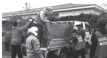
長野市災害 ボランティア活動

*ボランティア活動支援助成(73団体と3個人)2,250,367円 *災害ボランティアフォローアップ研修1回 *長野県長野市での災害ボランティア活動