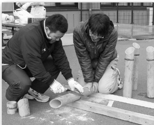
◇12月12日(日) 神崎支庁舎での 竹筒、ろうそく作りの様子

震災で亡くなられた方の慰霊と鎮魂、そして震災から生まれた絆や支えあう気持ちを大切にすることを語り継いでいければと思います。 ご協力頂きました皆様、本当に有難うございました。