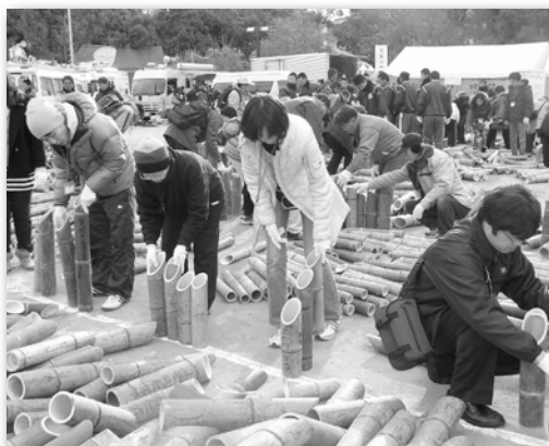
◇1月16日(日) 神戸市東遊園地での竹筒並べの様子