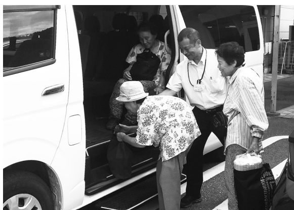
『お買い物送迎サービス』の様子