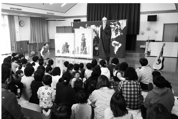
『きらきら☆お楽しみ会』の様子

町内の小学、中学、高校へボランティア活動や福祉活動に取り組んでもらう助成金を交付します。また、