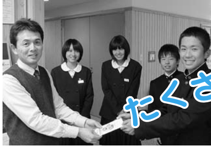
(大河内中学校の生徒さんより)