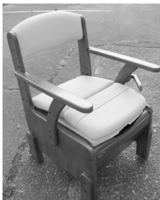
②簡易トイレ (ポータブルトイレ)

折りたたみができ、座面がスポンジで水に濡れても滑りにくいので風呂場で活躍します。高さの調節が可能なため、低い所からの立ち上がり辛い人への味方になります。