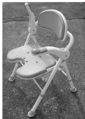
①風品用椅子 (シャワー椅子)

折りたたみができ、座面がスポンジで水に濡れても滑りにくいので風呂場で活躍します。高さの調節が可能なため、低い所からの立ち上がり辛い人への味方になります。