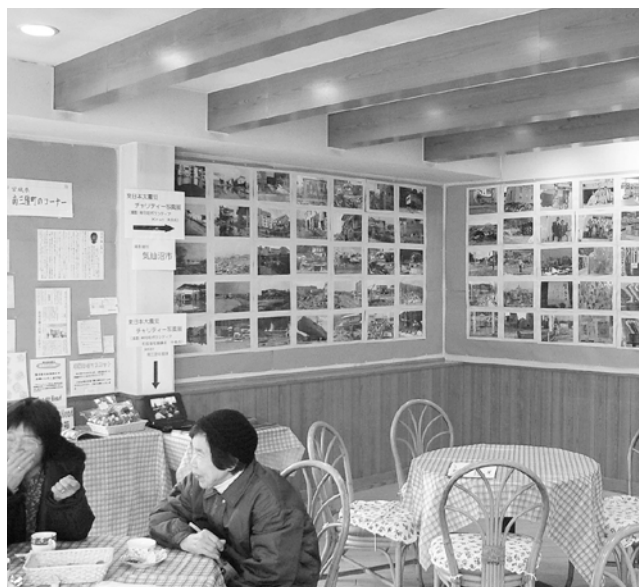
店内には被災地の写真などと共に喫茶・軽食コーナー