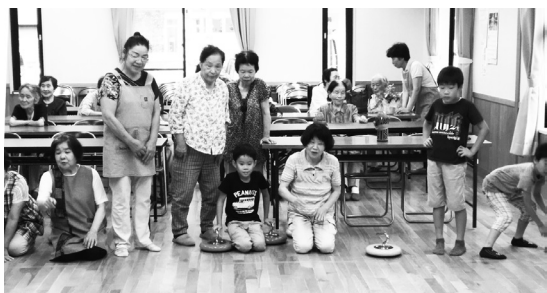
ミニデイで、ボランティアや参加者との交流ができました。