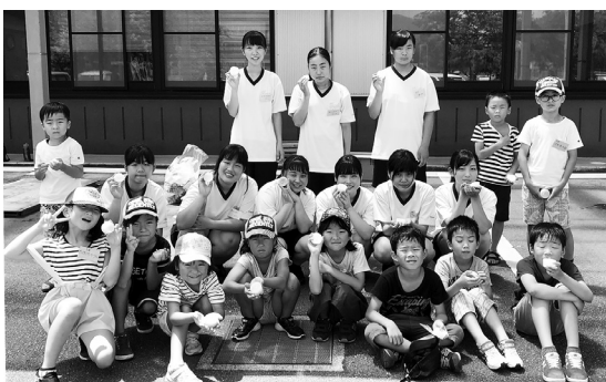
1. 17のつどいに送るたくさんのろうそくができました。