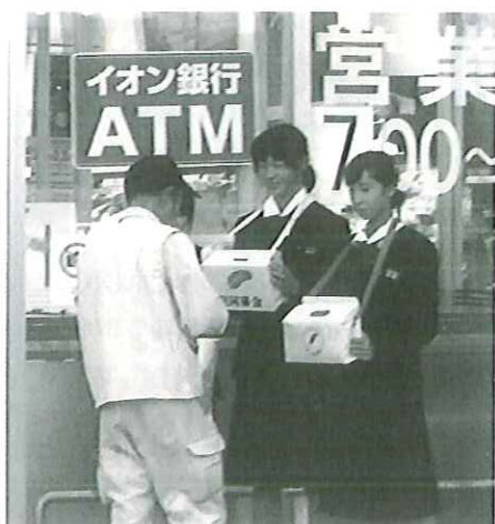
(神河中学生による街頭募金)