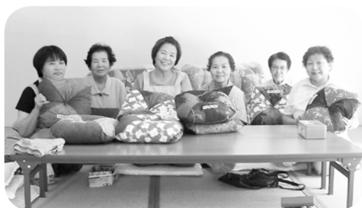
新たに 50 個できました！

昨年の秋から神崎総合病院の待合室に置いてある座布団は、神河町婦人共励会（母子、寡婦の福祉団体）が、『お年寄りが椅子からの立ち上がりしが易いように』と思いを含められて作られたものです。会の研修で鳥取に行った際、現地の共励会が座布団を作り、駅などに置いたところ喜んでいただいた事を知り、神河町の共励会でも座布団を作りました。置く場所を探していたところ総合病院から希望があり、70枚を待合室に置いたところ、大変喜んで頂き、各科の待合室にもほしいと要望があり、今回は50枚を作られました。