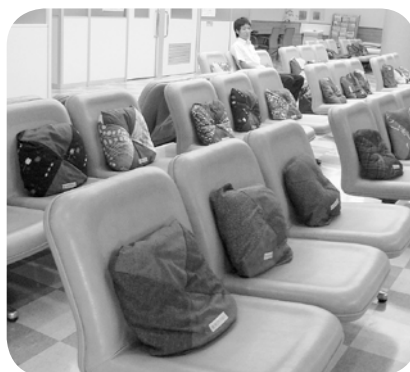
総合病院においてある座布団