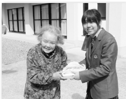
配食ボランティアが手渡しでお届