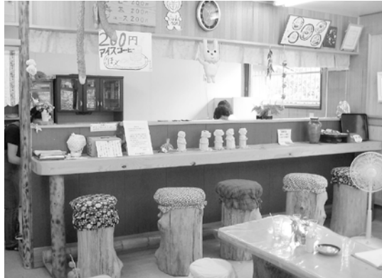
「ほっと」店内の様子

町内の住民が自主的に行っている活動を知りたいと思い、大畑にあるふれあい喫茶「ほっと」へ伺いました。店内では、地域のお年寄りから子ども達が描いた絵が貼ってあったり、手作りの木彫りが飾られていたり、とても明るい雰囲気でした。この日「ほっと」にこられていたお客さんは、とても楽しそうな表情で、「皆と話せるし、コーヒーも飲めるから毎週ここに来るのが楽しみ」と話しておられました。