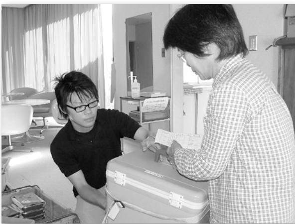
配食ボランティアへお弁当を手渡し

最後に、実習期間中は、伺った地域の皆さんが温かく迎えてくださり「頑張ってくださいね。」と言う言葉がとても励みになり、そして心に残っています。神河町の皆さん本当にありがとうございました。