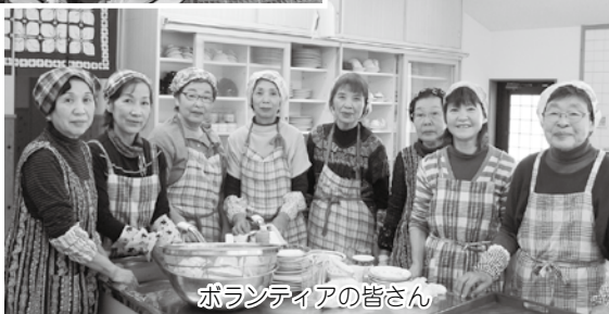
ボランティアの皆さん

ロビーでは営農組合の方が新米や山芋を販売されたり、「ご自由にどうぞ」と柿がたくさん置いてありました。地域の皆さんの憩いの場、そして交流や見守りの場として、みんなで大切にされ長年続いている「つどい場」です。