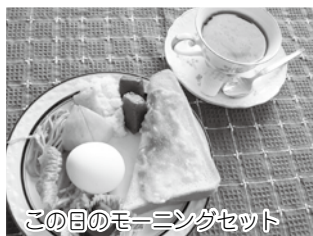
この日のモーニングセット

「喫茶を楽しみにしていると言うみんなの声が励みになって、私達も楽しみながら頑張っています。」