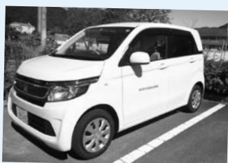
姫路十字会から助成金をいただき、古くなった社協のホームヘルパー車を買替えることができました。

近年、全国各地で様々な自然災害が頻発しています。昨年の丹波市の豪雨災害では、谷沿いの集落を中心に土砂崩れなどが発生し、1人が死亡、4人が重軽傷を負われました。このような大災害は決して他人事ではなく、いつ神河町で起こっても不思議ではありません。 社協では災害時の対応マニュアルを作成し、見直しや研修を行いながら災害に備えています。災害時に大きな役割を担う『災害ボランティアセンター』を運営するためには、スタッフの人数が大幅に不足しています。 そこで、『災害ボランティアセンター』のスタッフとして活動いただくボランティアの養成研修を次のとおり開催します。まずは『災害ボランティアセンター』の役割などを理解していただき、ぜひ運営スタッフとしてあなたの力を貸してください。 ご参加をお待ちしています。