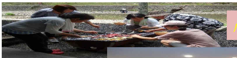
バーベキュー雑談会