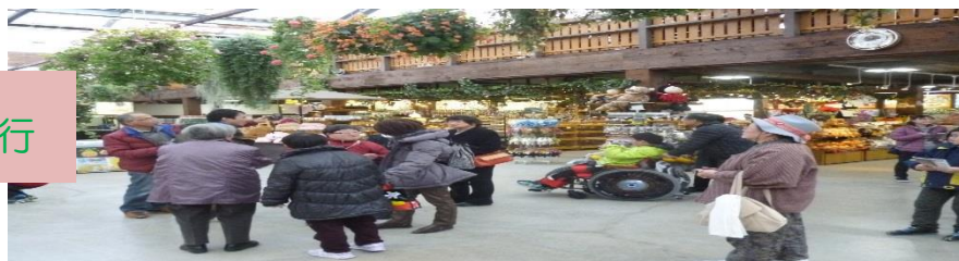
町の野外活動旅行