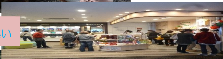
神崎郡親と子の集い