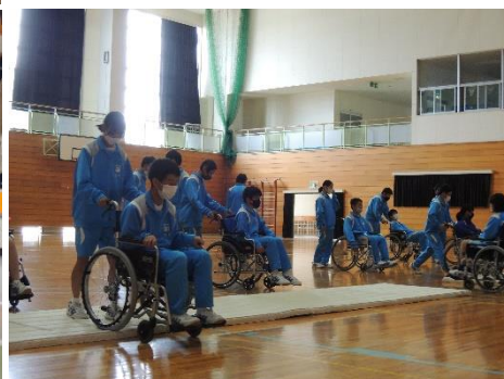
町内各学校での福祉学習