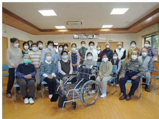
車いすを各自治会の公民館へ寄贈