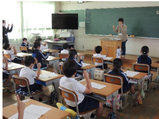
ボランティアグループによる手話教室