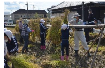
老人クラブ稲刈り体験