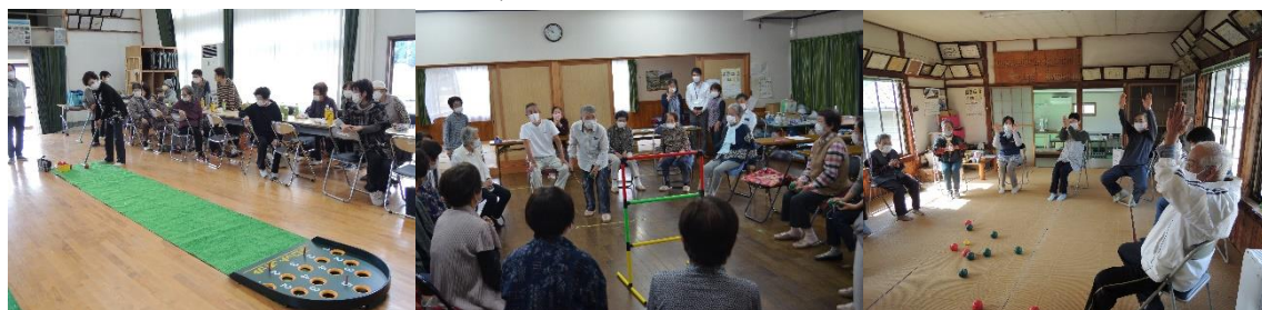
ふれあいサロン各会場の様子