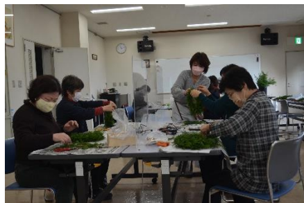
クリスマスリースづくりの様子