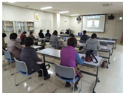
リモート研修の様子

各種福祉団体の事務を行いました。コロナ禍により、会員多数が集まる行事は中止となりましたが、感染対策を徹底した会合や屋外行事、リモートによる研修会等、福祉の充実に向けて取り組みました。