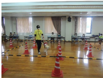
盲導犬の活動の様子