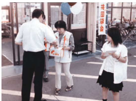
ピアゴ十四山店にて