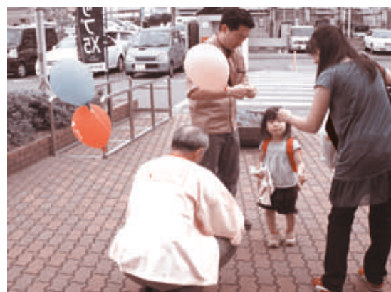
ウイングプラザパティにて

各事業所様のご厚意により、街頭募金を実施しました。 ご協力いただいた皆様、誠にありがとうございました。