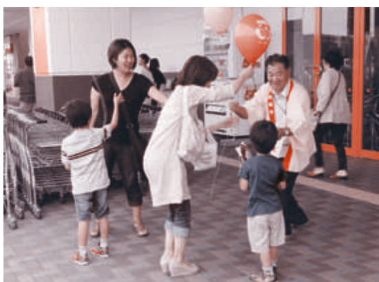
イオンタウン／ザ・ビッグエクストラにて