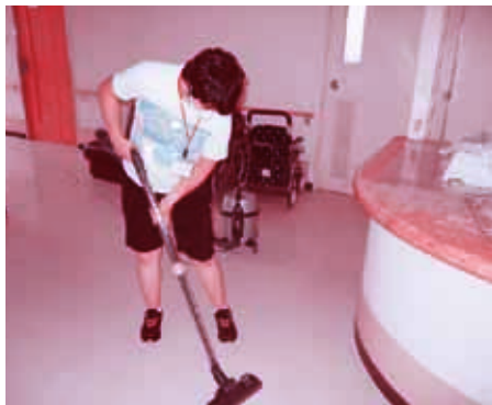
施設外実習の様子

昨年の7月末より2週間、利 用者2名が市内の特別養護老人 ホームのご厚意で、清掃の施設 外実習を行うことができまし