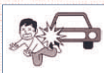
(2) ボランティア活動に向かう途中、交通事故にあった。