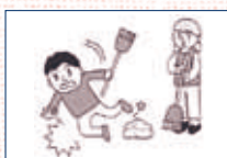
(1) ボランティア活動中に転んでケガをした。

① 傷害事故 ボランティアがボランティア活動中の急激・偶然・外来の事故によりケガをした場合に保険金をお支払いします。