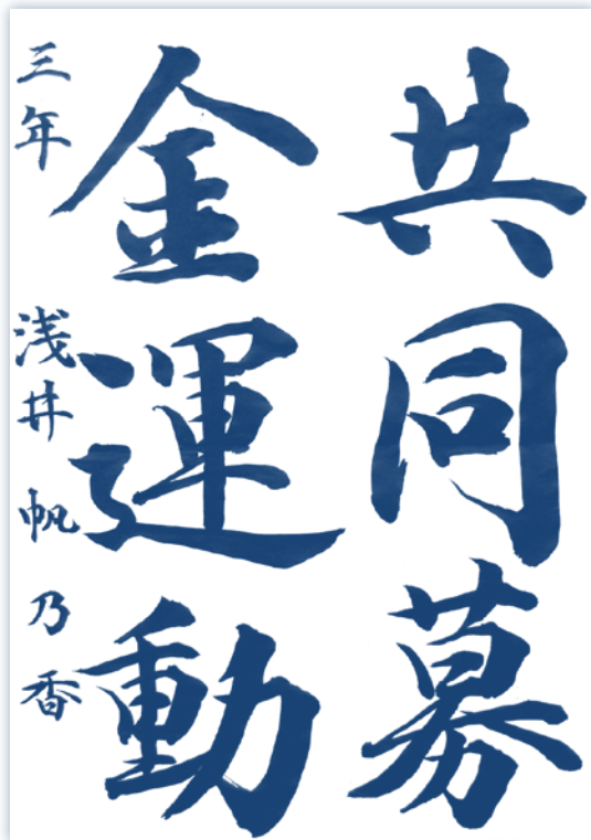
弥富中3年 浅井 帆乃香