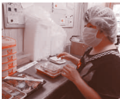
施設外実習の様子

昨年11月2日(金)に、機能 回復訓練の一環として、名古屋 屋港水族館に社会見学に行き ました。現地では、4つのグ ループに分かれて行動をする ため、前日にグループに分か れ各グループで見学ルートや 立ち寄るお店などを話し合 い、計画を立て、当日に備え ました。当日、急きょ見学 ルートの変更を行った班もあ り、自分たちの計画通りにす べてが上手くいった訳ではあ りませんが、普段では見せな い積極的な態度を見せるなど