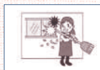
(2) 家事援助ボランティア活動で清掃中、誤ってガラスを割った。