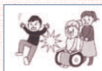
(1) ボランティア活動中、誤って他人にケガをさせた。

② 賠償事故 ボランティアがボランティア活動中の偶然な事故により他人にケガをさせたり、他人の物を壊したことにより法律上の損害賠償責任を負った場合に保険金をお支払いします。