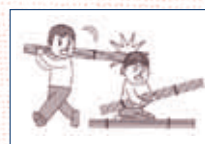
(3) ボランティア活動での後片付け中、誤って他人にケガをさせた。