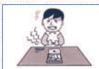
(3) 活動中、食べた弁当でボランティア自身が食中毒になった。

② 賠償事故 ボランティアがボランティア活動中の偶然な事故により他人にケガをさせたり、他人の物を壊したことにより法律上の損害賠償責任を負った場合に保険金をお支払いします。