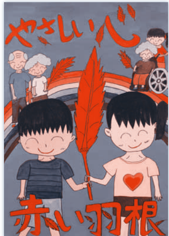
弥生小3年 安江 紗裕理