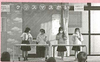
草平児童館 クリスマス会の様子

赤い羽根共同募金の一部を使わせてくれて、ありがとうございました。クリスマス会に使わせてもらいました。おかげで、かわいいクリスマスカードを作ったり、おかしをもらったり、とても良いクリスマス会になりました。発表の時の写真ももらえて、記念になりました。