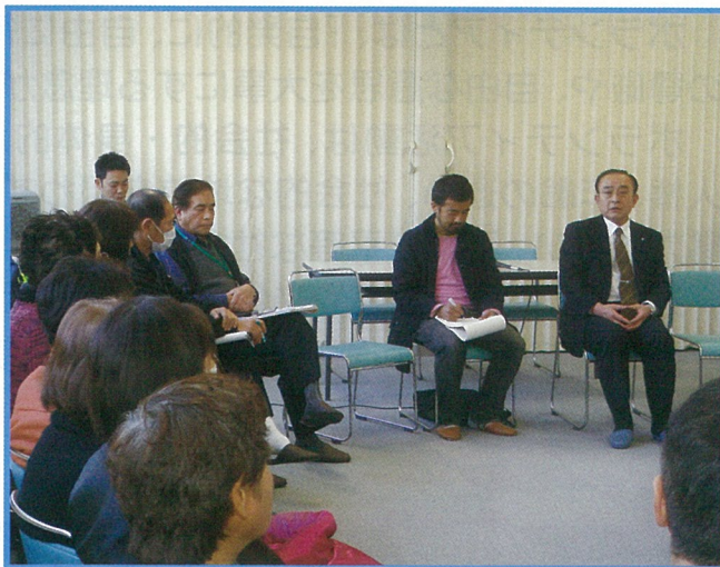
平成26年1月27日開催 町長によるミニ集会の様子

ボランティアは自分の為だけではなく、人の為、社会の為に繋がる活動です。ご興味のある方の参加をお待ちしています。