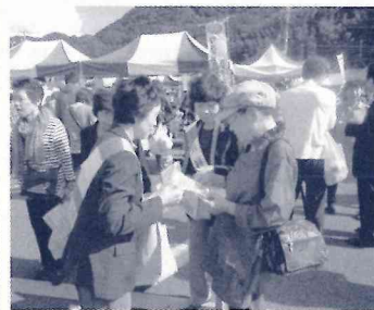
河津ふれあいまつりでの街頭募金の様子

赤い羽根募金配分事業として、高齢者、障害児者、児童青少年、母子父子世帯、ボランティア活動育成等の事業を実施 歳末たすけあい募金配分金による事業