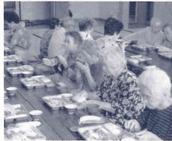
一人暮らし高齢者昼食交流会の様子

平成26年度末配食対象者24名 要援護高齢者の慰問…一人暮らし高齢者等157名 紙おむつ等の幹旋