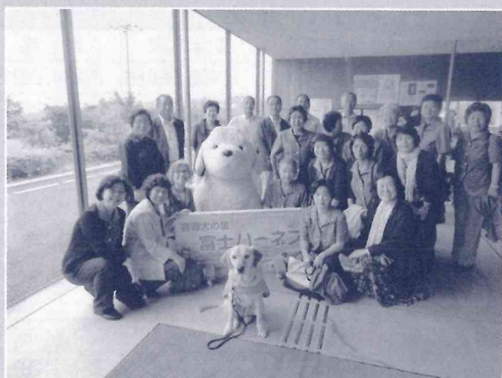
PR犬とともに、富士ハーネスにて

6月9日に、河津町民生委員児童委員の平成27年度の視察研修を行い、22名が富士宮市にある日本盲導犬総合センター「富士ハーネス」を訪問しました。センターでは、盲導犬となるために必要な訓練を、実際に訓練士とPR犬が行う様子を見学したり、盲導犬を連れた障害者の方に接する時の注意点などを訓練士から説明を受けました。施設内には訓練スペースの他、目の不自由な方が盲導犬とペアを組み、同居生活を送るなかで最終的な訓練を行う居室や、引退した盲導犬が余生を過ごす場所もあり、盲導犬に関する総合的な施設となっているとのことでした。