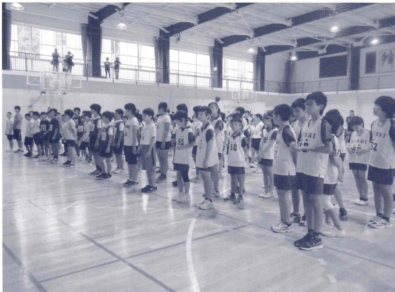
賀茂郡子ども会球技大会開会式の様子（西伊豆町にて）