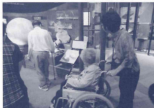
身体障害者社会学級 バス遠足

※残りの30%は、県内の広域的な課題解決(福祉施設等の車輛購入など)の為に配分されています。また、今年度集められた募金については、平成27年度に河津町社会福祉協議会に配分される予定です。