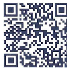
二次元バーコード