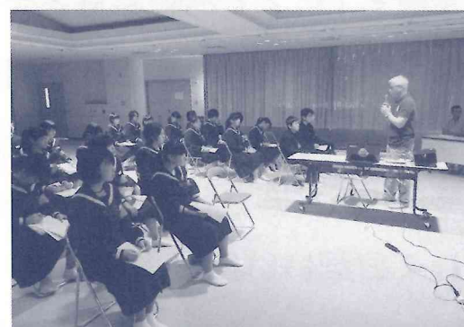
中学生ボランティア 講座閉講式