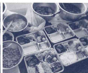
おかずを盛付け中