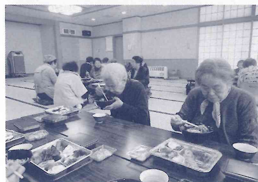
一人暮らし高齢者 昼食交流会