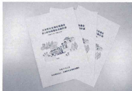
第2期地域福祉活動計画の冊子

河津町社会福祉協議会では、平成24年3月に河津町が策定した河津町第2期地域福祉計画に基づき、地域住民と民生委員児童委員協議会や老人クラブ連合会、身体障害者福祉会等の福祉団体、その他ボランティア団体などの社会福祉関係者からのアンケート調査や聞き取り調査を行い、策定委員会での審議や修正を経て、平成25年2月に「第2期地域福祉活動計画」を策定しました。今後は、この計画に基づいて、社協、地域、事業者、各福祉団体、行政との協働により様々な取り組みをすすめてまいります。