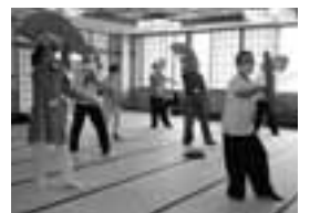
さくらサロン「太極拳」