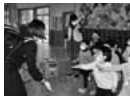
中学生福祉教育 フォローアップ事業