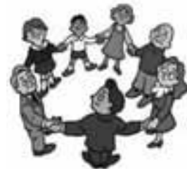
住民のみなさんが 地域づくりの主役