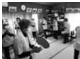
シニアクラブ河津 女性部交流活動