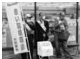
赤い羽根共同募金街頭募金