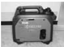
災害用資機材として購入