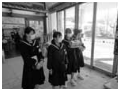
歳末たすけあい募金運動