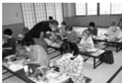
さくらサロン「絵手紙教室」