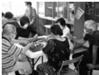
健康マージャンサロン