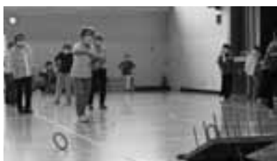
シニアクラブ河津輪投げ大会