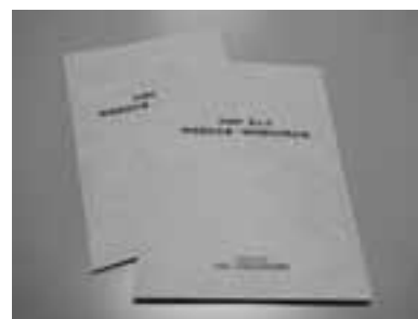
地域福祉活動計画