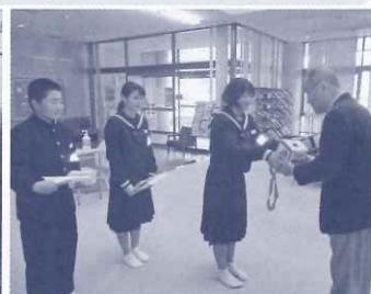
河津中学校生徒会