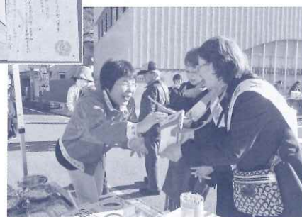
軽トラ市での街頭募金