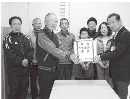
歳末たすけあい募金 受け渡しの様子