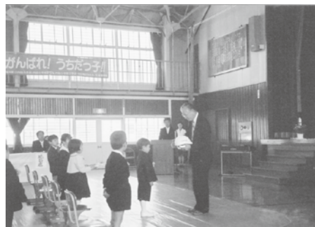
ヘルメットの贈呈