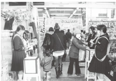
歳末たすけあい募金風景