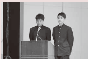
常葉大学附属菊川高等学校の生徒による司会ボランティア