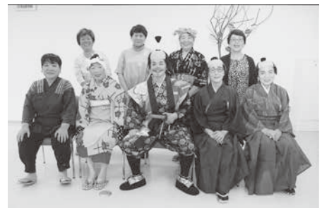
民謡の発表会（中央公民館）

たいした会（寸劇グループ）で、劇を上演するときに、観客を巻き込んでしまうことです。もともとの台本も風刺が効いた面白い作品ですが、観客の方と交流しながらアドリブを入れていくと台本以上のものになり、演じていてとても楽しいです。おかげさまで評判も良くて色々なところから依頼があり、月に何度か上演することもあります。メンバーみんなで協力しないと続かないことなので、みんなで頑張っています。