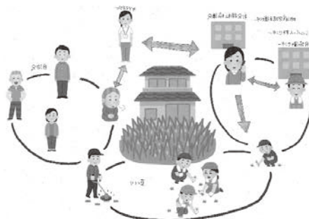
草刈りボランティアイメージ

最近自宅の庭や、自宅周りの草刈りに関する相談が増えてきています。本来、草刈り等の業務は専門職やシルバー人材センターが行っていますが、様々な事情で依頼できない方もいらっしゃいます。そういった方達の為にボランティアの力が必要になってきます。