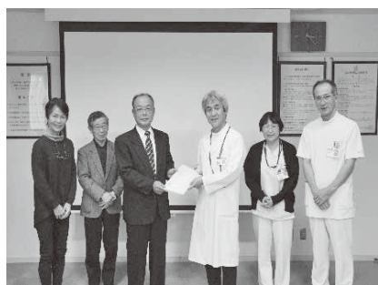
感謝のメッセージ伝達