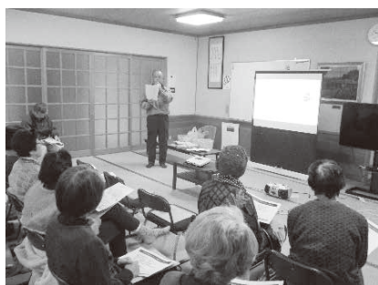
地区サロンでの出前講座

総会、定例役員会、住民が地域医療を育む【5つの『か』活動】出前講座、勉強会、たより発行、菊川市立総合病院との懇談会、医療従事者への感謝のメッセージ伝達、認知症家族支援「にこやか家族の集い」、地域医療シンポジウム等広域啓発活動への参加