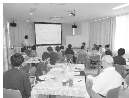
にこやか家族の集い