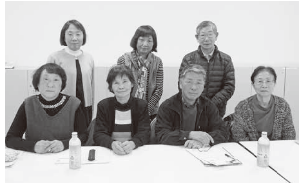
モニター会議後の写真