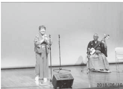
たいした会“へっこきあねさ”

もう1つの趣味はプラバンとレジンのアクセサリー作りです。娘と一緒に作っています。フリーマーケットで販売したり、わらべコーラスなどの発表会で衣装に合わせたアクセサリーを作ってみんなお揃いで付けたりして楽しんでいます。