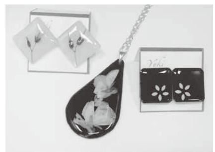
プラバンとレジンのアクセサリー

好きな言葉『笑顔美人』。いつも笑顔で、いつまでも皆さんと活動できたらいいなと思っています。みんなから笑顔をもらって、みんなに笑顔をあたえたいです。主人が家を守ってくれているので安心して出掛けられます。感謝を込めて毎日笑顔で過ごしたいですね。