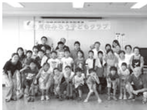
夏休みこどもクラブ

体調に気を付け（血圧が上がらないように）、船に乗って海釣りを楽しみたいです。大きい魚を釣ったことが無いので、大きな魚を釣ってみたいです。