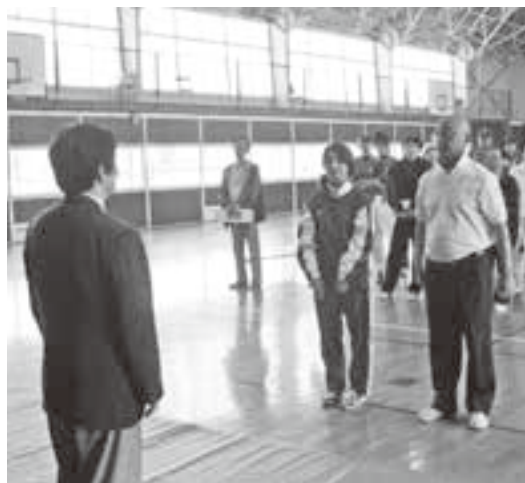
第38回静岡県ろうあ者体育大会

全日本ろうあ連盟60周年でつくった映画「ゆすり葉」に出演したことも印象に残っています。監督もろうあ者で、ろうあ者の理解に努めるには良い映画です。