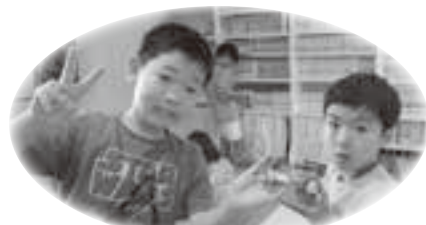
ラキューで動物作り (小中高生プレイルーム)