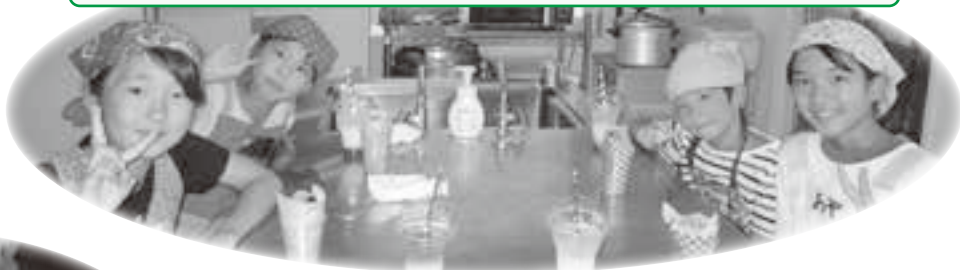
花束クレープとトロピカルフィズ♡ (小学生夏休みクッキング)