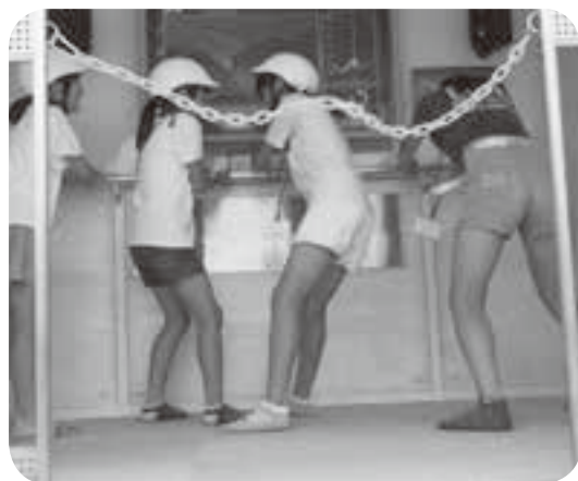
通学合宿にて（地震体験車）