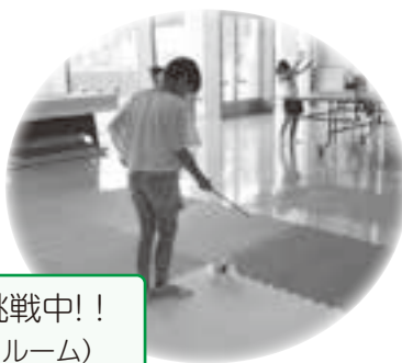
ディアボロに挑戦中!! (小中高生プレイルーム)