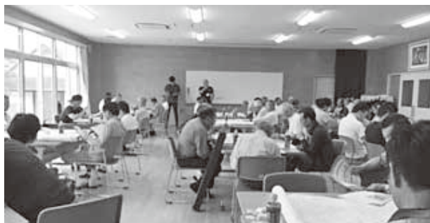
「小笠東地区 講演聴講の様子」