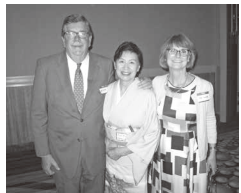
アメリカでの交流会

とにかく前向きに物事を考えるようにしたいです。ケ・セラ・セラ!そして“はんなりと着物”を着て過ごせる時間をもちたいですね。