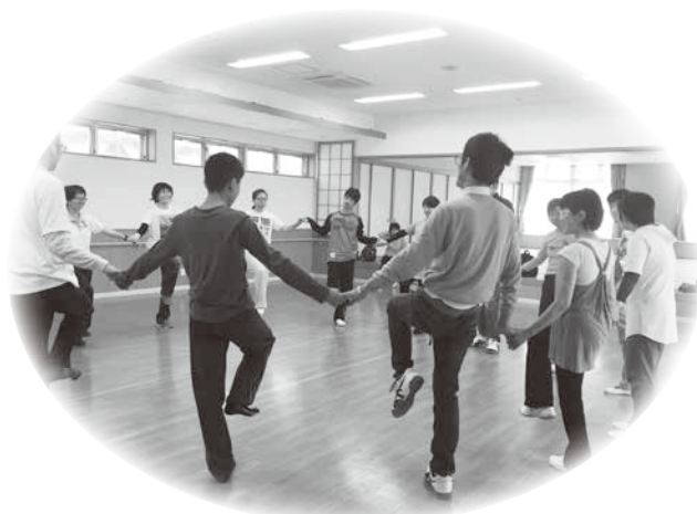
みんなで手をつないで楽しくダンス!

今後も無理のないペースで、親子のリフレッシュ、交流の場として、続けていければいいと思っています。会場のスペースの関係で、新規募集はしていませんが、興味のある方、ご協力して下さる方がいらしたら、お気軽にお問い合わせ下さい。