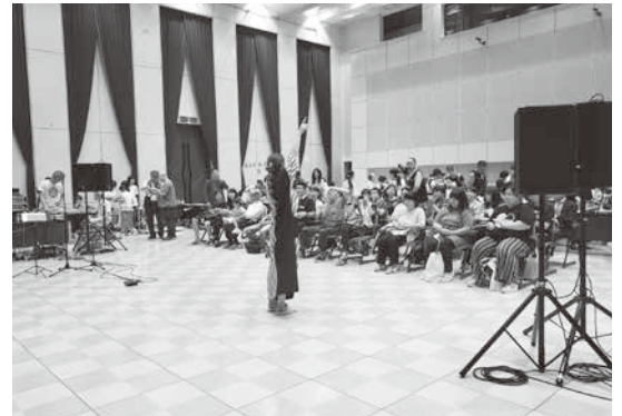
「みんな元気パワフル・ジャンプきくがわinアエル」