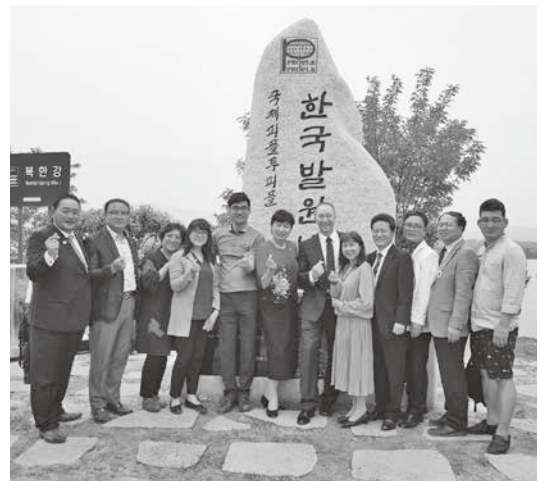
韓国での除幕式後の1枚

交流派遣でも中学生に「どこに行ってもあなたは日本人でありバックグラウンドは菊川であり、それを外から見てもらい、自分で異なる文化を体感し、自分の置かれている環境やご両親を始めとする皆さんに感謝してほしい」と伝えています。