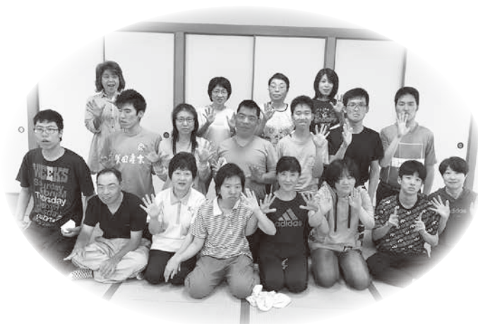
先生を囲んで、みんなでハイポーズ!

現在は、菊川市内だけでなく、掛川市、牧之原市の方も参加してくれるようになり、親子合わせて24名で活動しています。仲間の輪が広がり、気軽に情報交換のできる場ともなっています。