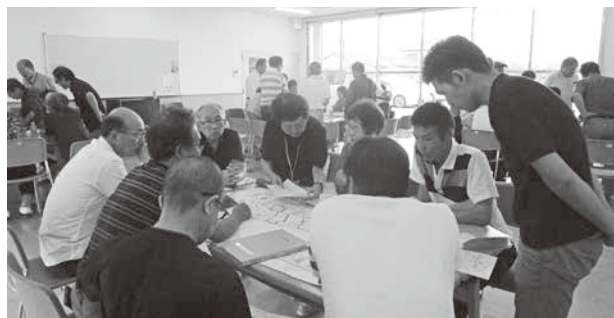
「嶺田地区 取り組みの様子」

嶺田地区・小笠東地区のこの取り組みは、地域に即した活動事業となっており、集まった方々で情報交換しながら「見守りマップ」という地図に落とし込み、視える化し、地域の支え合いの絆を深め、共有しました。