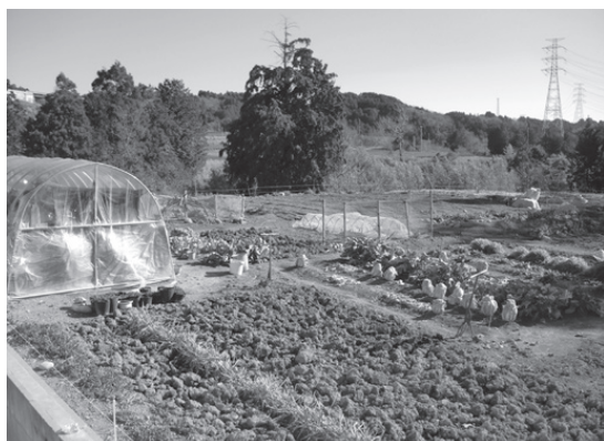
野菜作り頑張っています

ひと月に一度くらいお墓参りに行くと、誰かしら知り合いに会います。そこで話をするのも楽しみです。