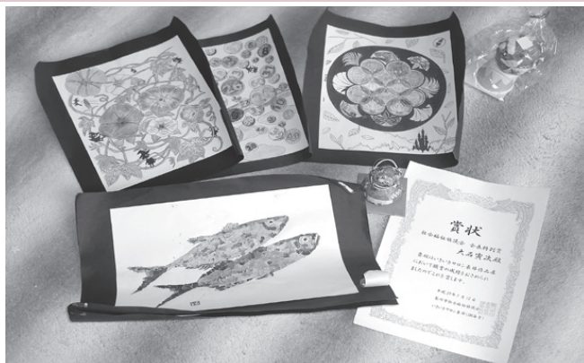
高齢者サロンで作った作品

年に4回、公会堂で地区の高齢者のサロン（沢水加サロン）があり、歌謡ショーやレクリエーションをやっています。毎年6月のサロンで輪投げ大会が行われ、そこで優勝して金賞のメダルをもらったのが嬉しかったです。