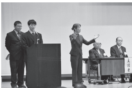
南陵高等学校の生徒による司会ボランティア