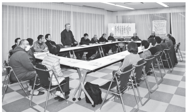
週1回 例会活動が続けております。 (菊川市町部地区センター)