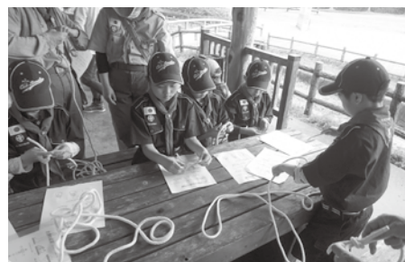
ロープ結びの練習

野外活動を中心に、心や身体を育て、さまざまなことを学びます。野外活動などの体験をとおして、自然を学び、友情や協調性などを育てることが中心です。工作やゲーム、歌、演劇などの活動、手旗やロープ結びなどの練習、キャンプ生活の基本を学びます。春休みや夏休みには長期キャンプも行います。