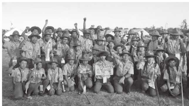
日本ジャンボリーで仲間たちと撮影