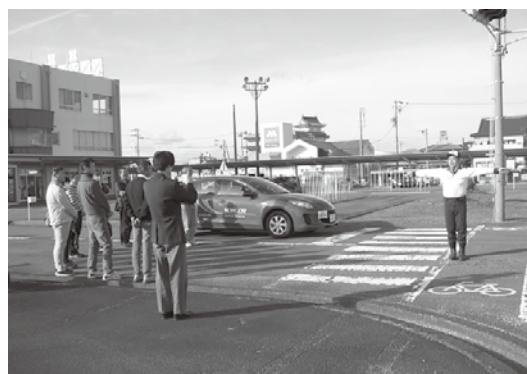
コース内での様子