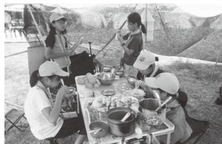
キャンプでの食事風景

ボーイスカウトと聞くとイメージするのはキャンプやハイキング、そして街頭募金などと言われます。ボーイスカウト活動は、野外で、子どもたちの自発性を大切に、グループでの活動を通じて、それぞれの自主性、協調性、社会性、たくましさやリーダーシップなどを育てていきます。1907年にイギリスではじまった青少年教育活動は、今、世界では169の国と地域、約4,000万人、日本には団と言われる活動母体が約2,000あり、約10万人が活動しています。