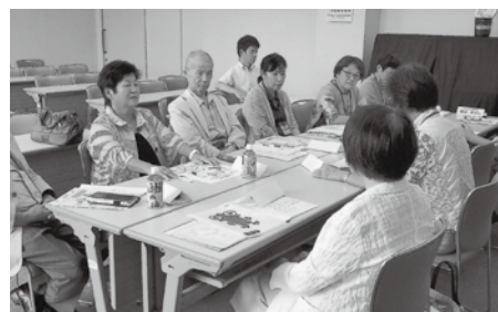
研修に参加した時の様子

一握りのサポートですが、その中で高齢者の方の笑顔をたくさん見ることができたのが、今までで一番良かったなと思っています。仕事をしていた時とは全く違う充実感があり、自分も楽しんでやっています。自分ができる間は、やってあげたいなと思っています。横で話を聞いていてあげるだけですが、落ち着いた気持ちになり喜んでくれる高齢者の方や、楽しみにしていると待っていてくれる方もいて、私にとっても張り合いです。