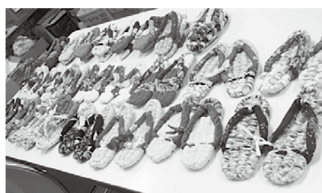
素敵な布ぞうりが出来上がりました

きくがわ社協だよりを通じて布の提供のお願いをしたところ、たくさんの方からお寄せいただきました。その布からボランティアの皆さんの手により作られた布ぞうりは、菊川市内社会福祉法人などが行なうイベント（バザー）に提供し、売上金を福祉活動に活用するなど活かされています。ご協力ありがとうございました。