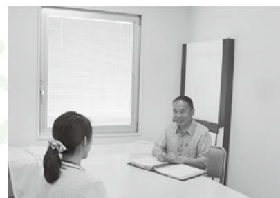
相談員との相談の様子（イメージ）