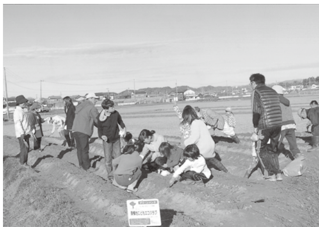
美化運動（チューリップの球根植付け）