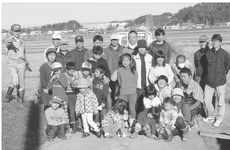
奥横地こどもエコクラブのみなさん