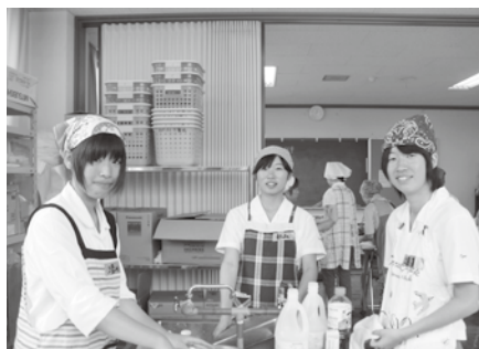
ボランティアの小笠高校生

高齢者への配食弁当活動（対象高齢者45名）を実施し、発足以来29年目を迎えました。本年度の登録会員は93名うち役員として、各自治会から18名、民生委員・児童委員3名、健康づくり代表2名の計23名で組織しています。本年度も役員代表者による総会を開催し活動がスタートしました。第1回目は各自治会の自治会長さんをご招待し、「総会のしおり」を基に活動内容を報告し実際に配食弁当を試食してもらってご理解を深めてもらっています。