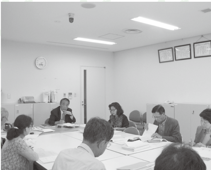
相談員定例会の様子

女性の方が登録しやすいように「女性のための相談日」も設けてあります。女性の方も積極的に登録してください。