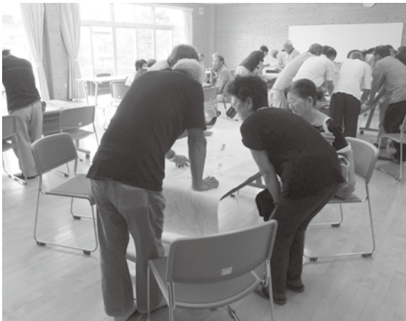
福祉見守りマップ作業の様子

7月24日（日）小笠東地区センターくすりんにおいて、小笠東地区福祉見守りマップ更新作業が行われました。