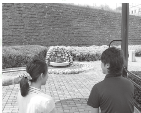
お見合いの様子（イメージ）