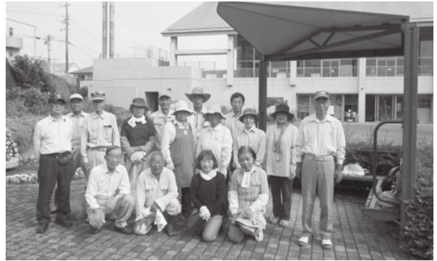
西風の会のみなさん

西風の会（菊川西地区民生委員児童委員退任者の会）の皆さんが、7月20日(水)と8月17日(水)の2回にわたり、プラザけやき内の草刈りや除草剤の散布などの作業をしてくださいました。子どもたちが利用する中庭を中心に、駐車場等、夏場を前にとってもきれいにしていただきました。暑い中、大変な作業を本当にありがとうございました。