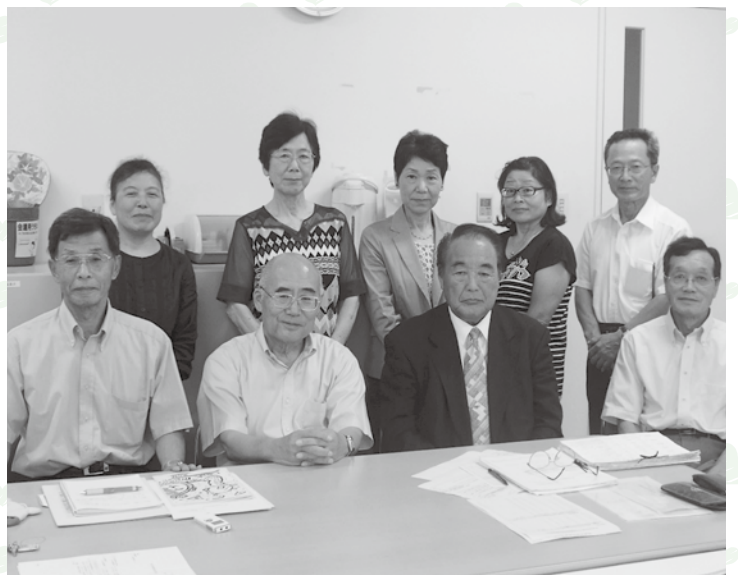
結婚相談員のみなさん