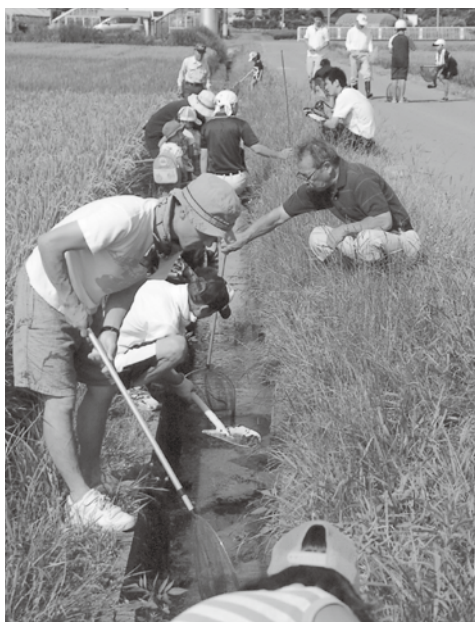
魚貝類の生息観察