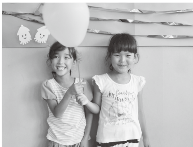
～児童館で遊ぶ子どもたち～

今回は、菊川市社会福祉協議会の結婚相談所を紹介します。結婚を考えている方、是非ご相談ください。ベテランの相談員が親身になって応援します。