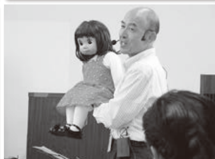
各地区で活躍する地域サポーター・団体の皆さん

現在、地域サポーターの方やボランティア団体の方が地域福祉のためにたくさんの活動をされています。今回は3月に策定された「第3次菊川市地域福祉計画・地域福祉活動計画」(平成28年4月～平成33年3月)を紹介します。この計画は市(行政)、社会福祉協議会、地域がつながりを持ち、さらに多くの方や活動を通じ、誰もが安心していきいき暮らせるまちづくりを目指したものです。