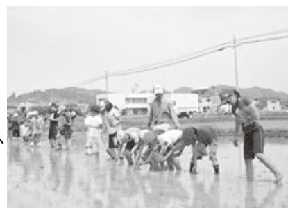
堀之内小学校5年生 米作り