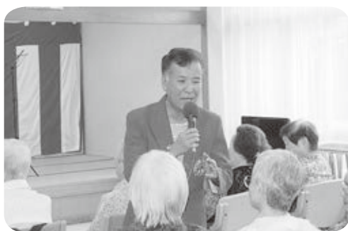
ボランティア活動の様子

か1人で歌うのは嫌がります。皆で歌いたいとおっしゃるので、いつも皆で楽しく歌っています。