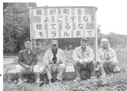
投棄防止啓発看板

の三つの精神をクラブ名にし、活動の基本としている西方地区のボランティアグループです。平成16年に発足、会員は男性のみ、活動は年間計画を立て、無理なく地道に続けていこうと、和気合い合い、楽しくやっています。